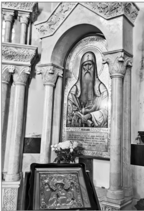
Икона преподобного Агапита Печерского

Что есть такой святой, я узнала, когда образовалось сестричество и мы начали ходить в часовню, в честь него освященную. Но кто